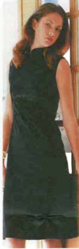
フィロソフィ・ディ アルベルタ・フェレティ