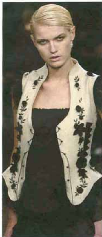
マウリッツィオ・ベコラーロ