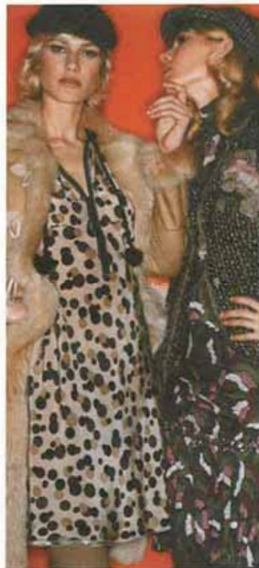
モスキーノ チープアンドシック