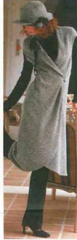
インポートロッサ