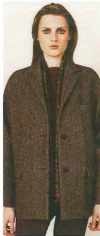
ピアッツァ・センビオーネ