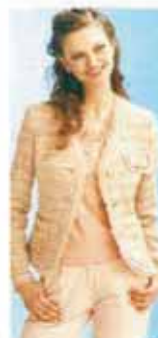
インポートロッサ