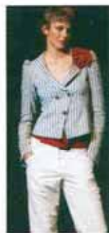
アルマーニコレツォーネ